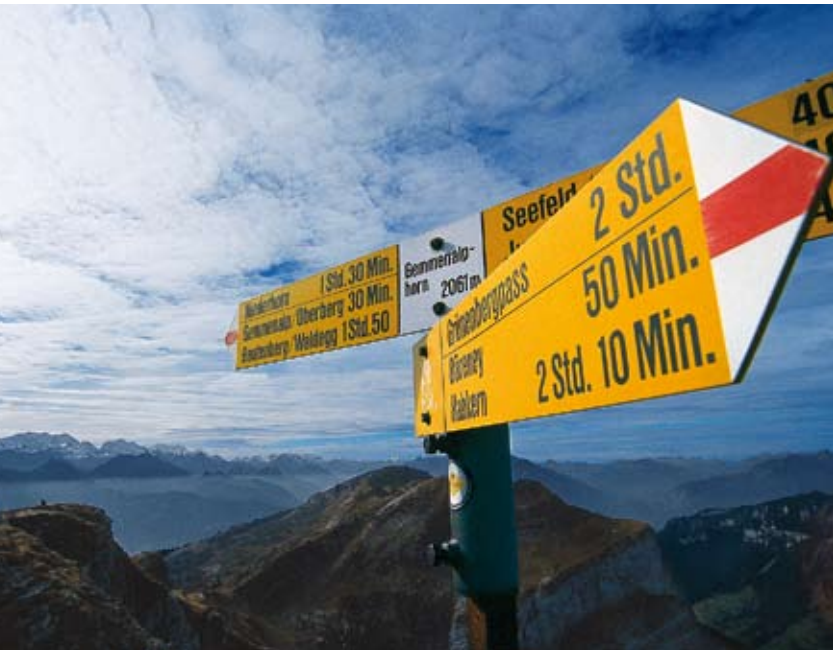
Der Wegweiser zeigt die vielen Möglichkeiten für den Weiterweg vom Gemmenalhorn.