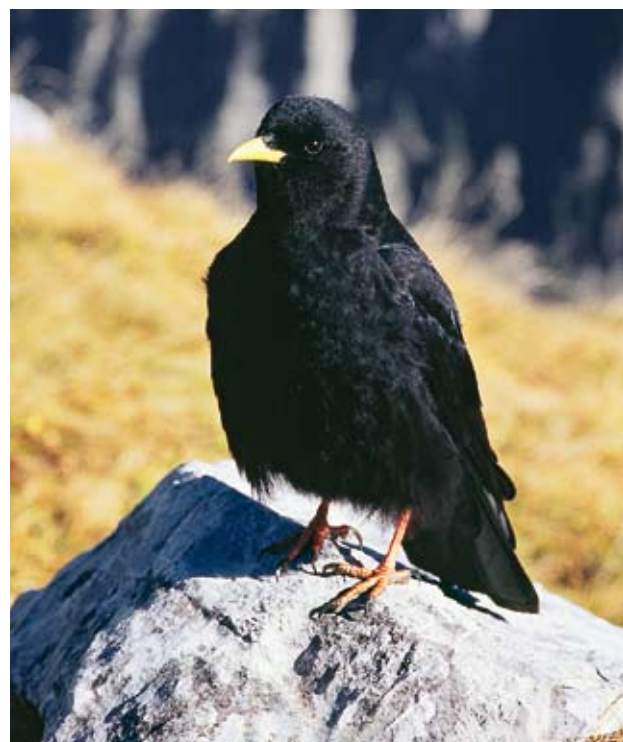
Besuch einer Bergdohle auf dem Sigriswiler Rothorn

wärts gegen das Felsband unter dem Burst. Undeutliche Pfadspuren führen südwestlich zwischen dem Felsband hindurch. Wiederum weitgehend weglos steigt man die steile Südflanke hinauf zum Gipfel des Bursts (1968,5 m). Über den Sigriswilergrat auf der andern Seite des Justistals wandert man wieder in Richtung Thunersee. Hier kann man wieder den Wegweisern folgen, die um das Sigriswiler Rothorn herum auf des-