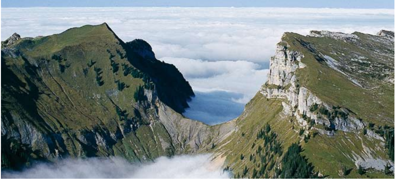
Lange Umrundung des Justistals: Die Sichle zwischen Burst (links) und Sieben Hengste über dem Nebelmeer im Justistal sind zwei der Stationen.