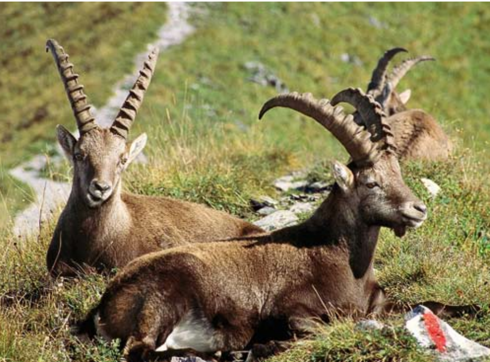
Oft machen es sich Steinböcke auf dem Bergweg zum Augstmatthorn gemütlich. Dann heisst es für Wanderer: warten, bis sich die Tiere zurückziehen.

T5, Aufstieg 2½ h, Abstieg 2 h. ▲ Fredy Joss, Waldegg-Beatenberg