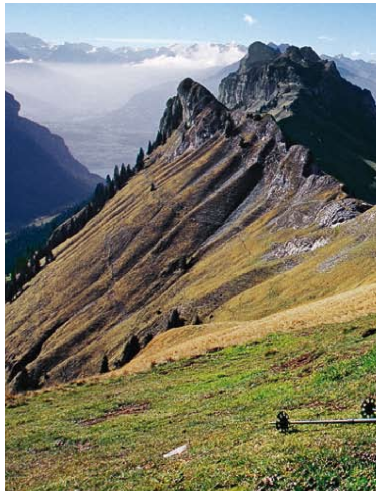
Blick vom Burst dem Grat entlang bis zum Sigriswiler Rothorn

die luftige Kante. Von der Höhe Sulegg steigt man weglos ab zum Schärhubel, dann wieder auf Pfadspuren via Lobhornhütte zur Alp Suls und zurück nach Sulwald. Mit Übernachtung in der Suls-Lobhornhütte SAC unternimmt man die Tour besser am zweiten Tag in Gegenrichtung.