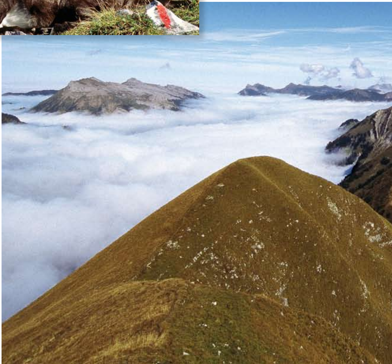
Weitsicht vom Augstmatthorn: Gleich einem Drachenrücken erhebt sich der Brienzerglat aus dem Nebelmeer.